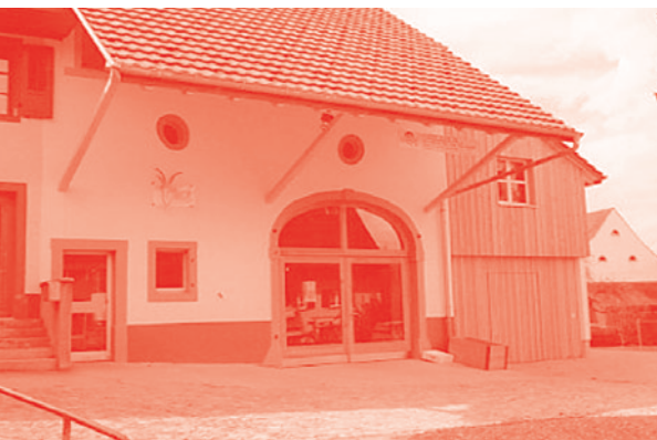
Das «Meck» im umgebauten Bauernhaus an der Geissgasse in Frick www.meck.ch

Wir laden alle Vereinsmitglieder ein, die Angebote zu nutzen, kulturelle Anlässe im Fricktal zu geniessen und ehemalige Fricker «Bezlerinnen und Bezler» zu treffen.