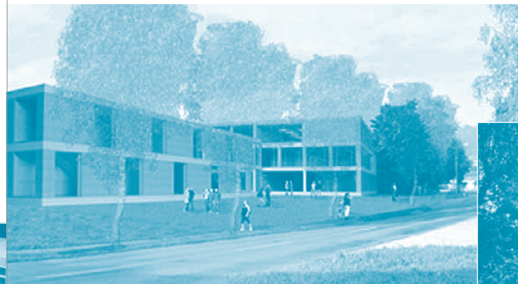
Links: Computergrafiken des neuen Oberstufenschulhauses, Einweihung Herbst 2005.