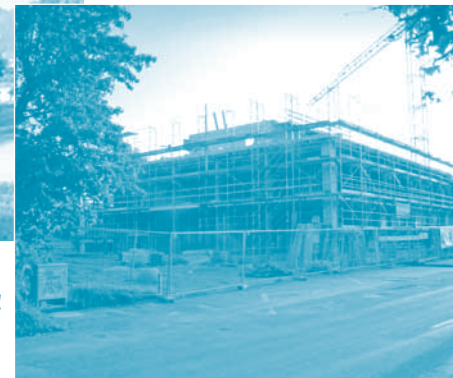
Rechts: Foto der Baustelle, Sept. 2004