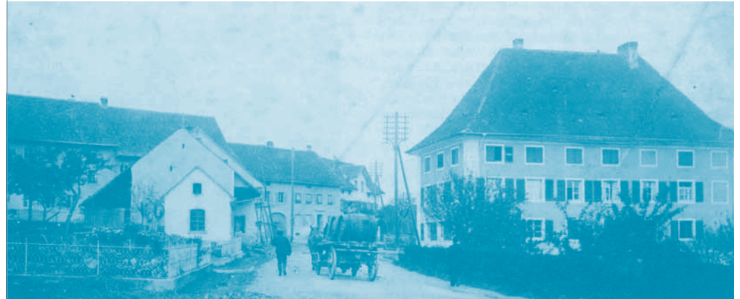
Frick (Unterdorf) um 1900. Rechts das ehemalige Zehnten- und Kornhaus, erbaut 1719. Von 1866 bis 1924 das erste Bezirksschulhaus.